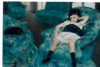
Mary Cassatt Little Girl in a Blue Armchair , 1878

Föreningens ordförande berättar om den amerikanska konstnären Mary Cassatt (1844-1926)